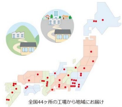
全国44ヶ所の工場から地域にお届け

また、全国9つの市町村と災害時の協定も締結しており、災害時における最大限の協力体制を整えています。